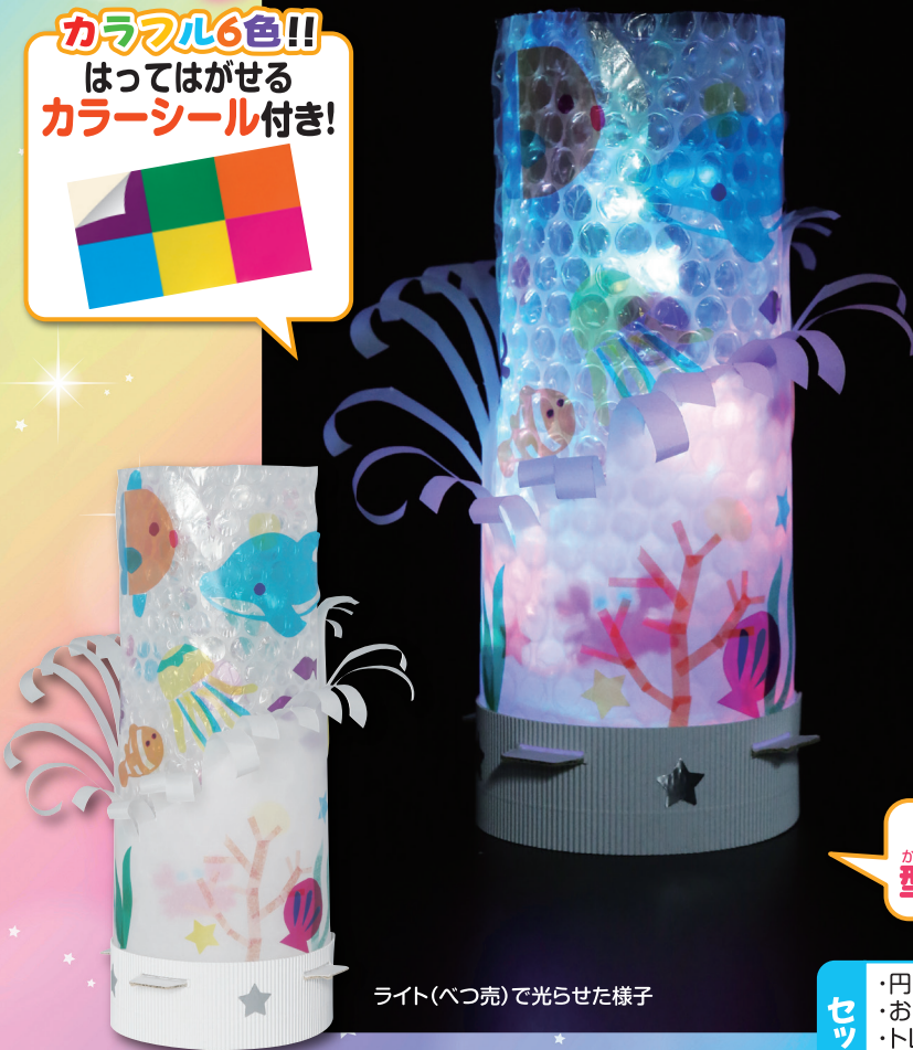
ライト(べつ売)で光らせた様子

はさみで切ったり、油せいペンで絵をかいたりできる! 型ぬき加工すみのトレーシングペーパー