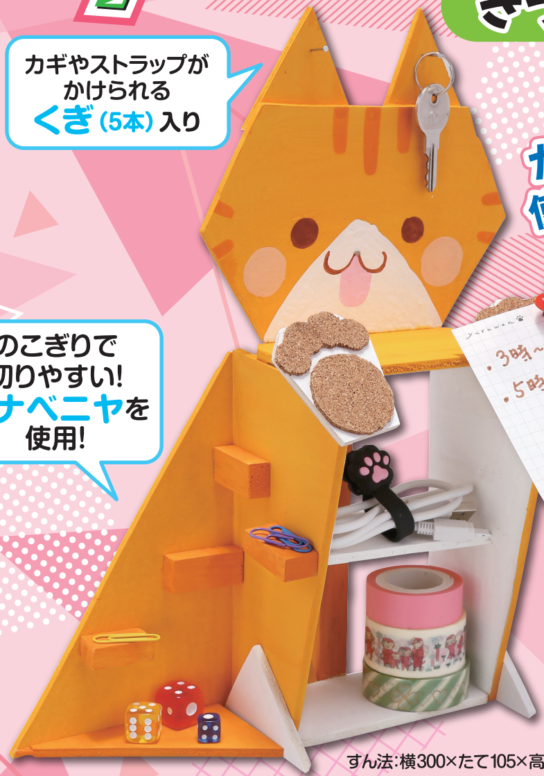
すん法:横300×たて105×高さ210mm